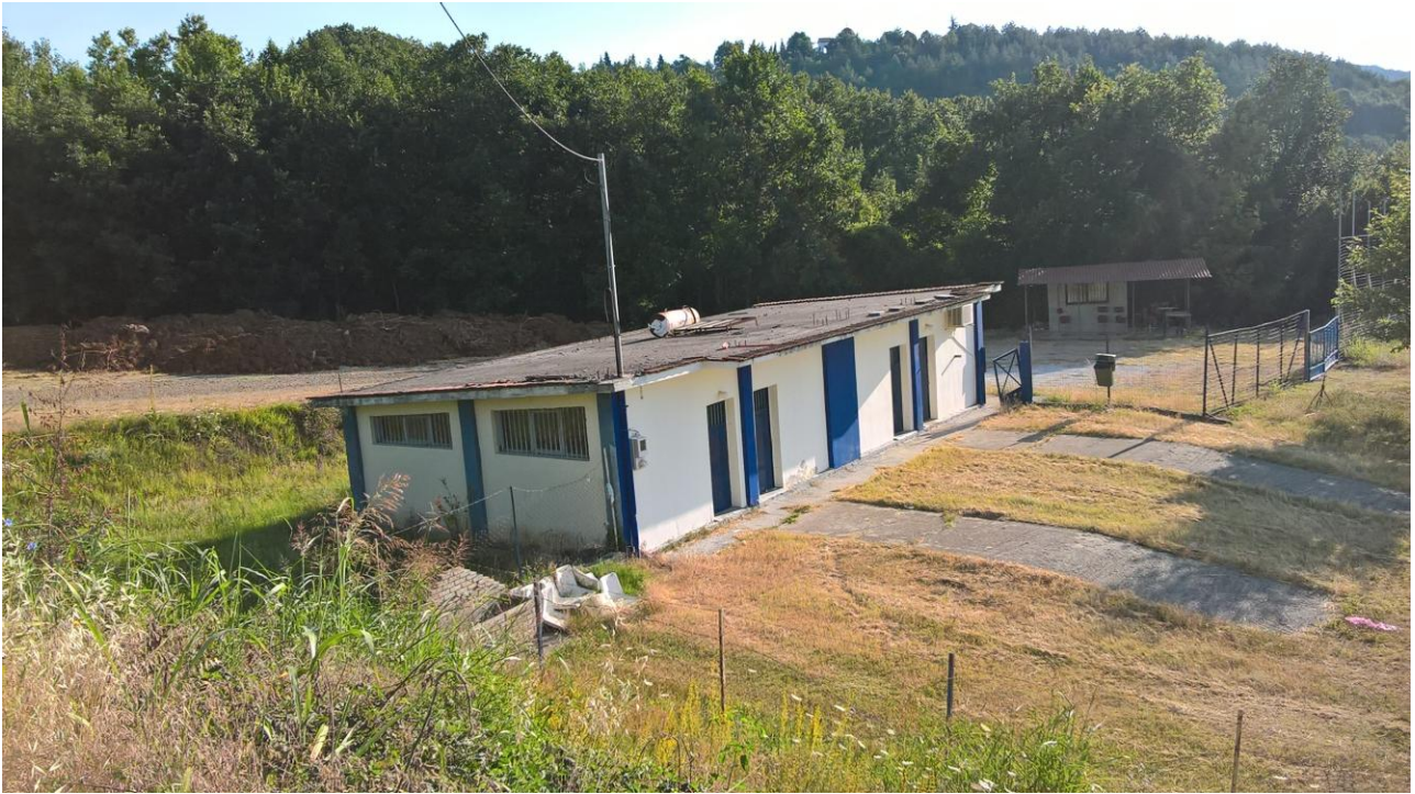
Εικ. 2: Φωτογραφία των αποδυτηρίων του γηπέδου ποδοσφαίρου στην Τ.Κ. Ροδοχωρίου