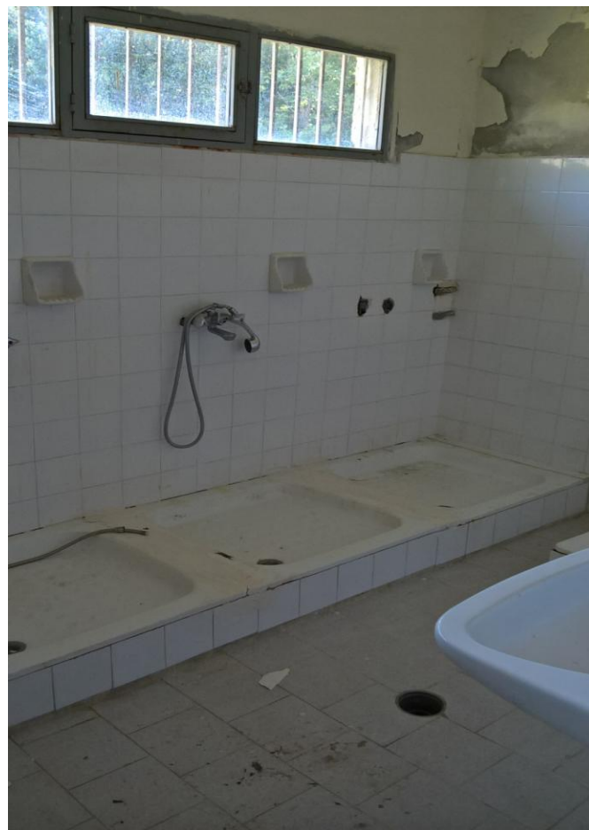
Εικ. 3: Φωτογραφία του εσωτερικού των αποδυτηρίων του γηπέδου ποδοσφαίρου στην Τ.Κ. Ροδοχωρίου

Προκειμένου να βελτιωθεί η κατάσταση τους απαιτούνται οι ακόλουθες εργασίες: